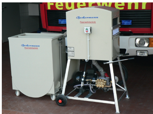
Lave-tuyau HSW 113 (illustré avec le bac de pré-lavage mobile EWT-PP 4/8)

L'unité haute pression sert de pompe d'aspiration puissante, qui est montée séparément de la salle d'eau sous la machine. Un tuyau d'eau spécial en acier inoxydable avec des buses à jet plat assure un nettoyage optimal avec une consommation d'eau minimale.