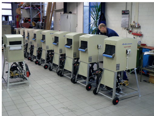
Pré-montage des rondelles de tuyau SW 113

Machine à laver des tuyaux haute pression mobile HSW 113 pour le nettoyage de deux tuyaux d'incendie de taille 25–45–70 ou d'un tuyau de taille 110, composé de :